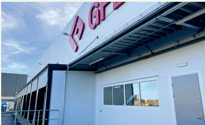
Bygget er sertifisert som Breeam Nor Very Good.