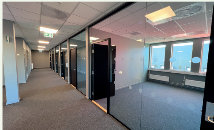
Cellekontorer i andre etasje.