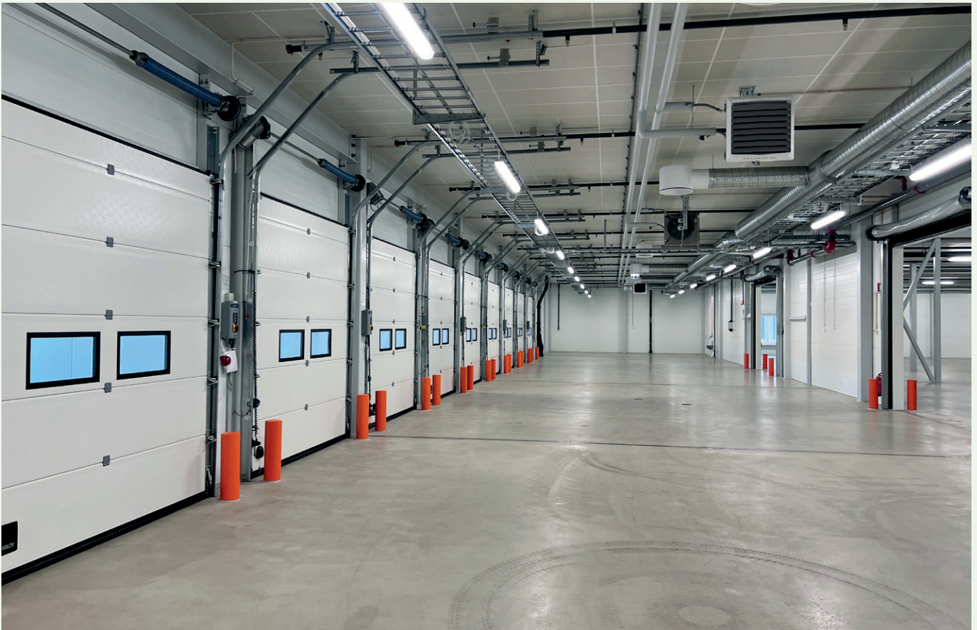
Det er etablert ti lastehus og porter på den ene siden av bygget.