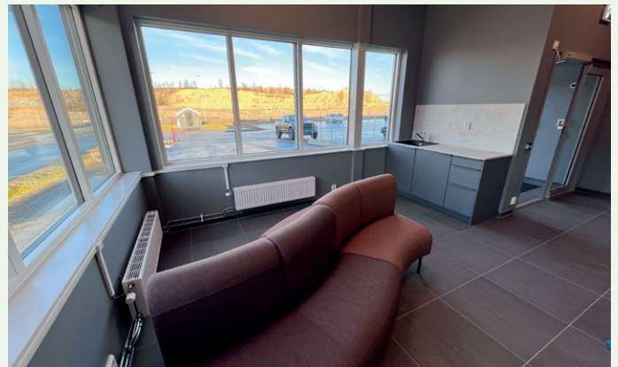
Velkomstsone for sjåførere.