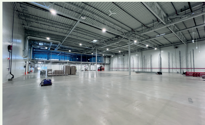
Lagerområde med god takhøyde.

Bæresystemet med stål og hulldekker startet 23. oktober og ble grunnet god planlegging ferdig to uker før estimert ferdigstillelsesdato, sier Nerli.