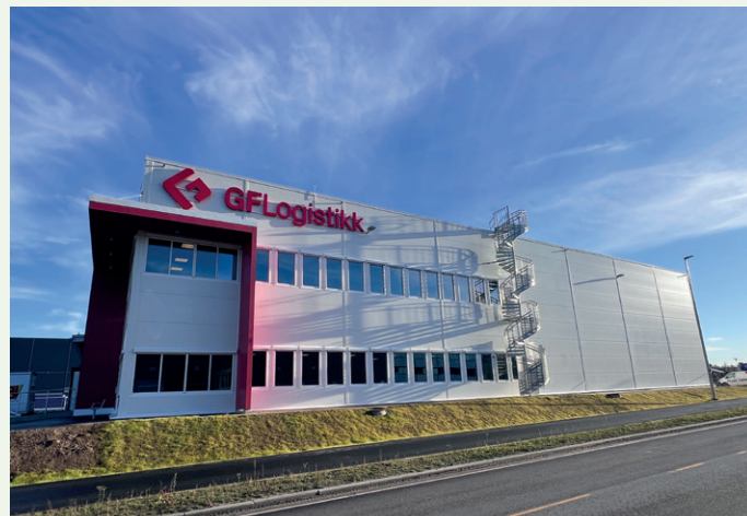
Bygget er samlet på 5.650 kvadratmeter.