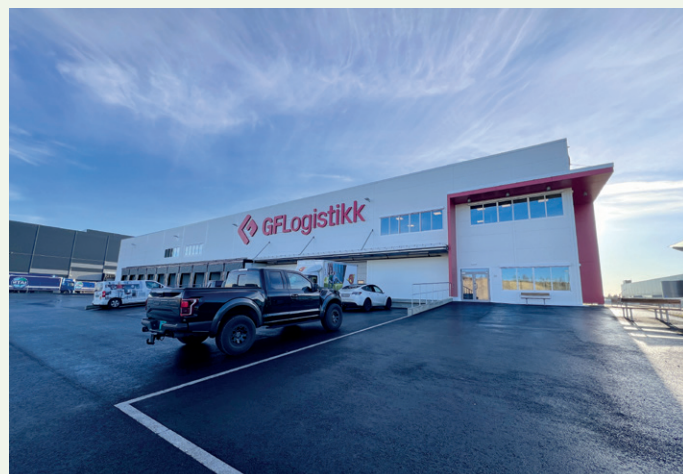
GF Logistikk hovedsentral, som ligger plassert mellom The World Seafood Center og Kunst- og verdilageret.