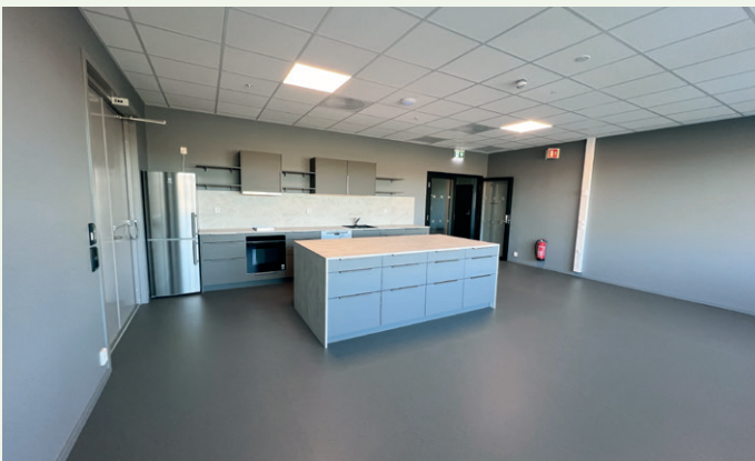
Kjøkken/kantine i kontordelen.